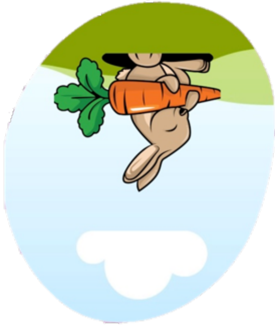
Rallye à la recherche du lapin de Pâques,